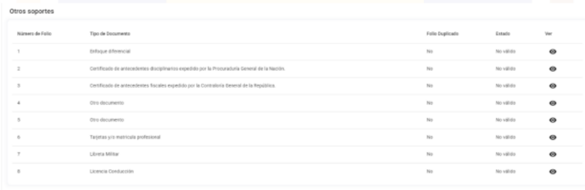
(Información Tomado del aplicativo SIDCA 3)

2. En relación al documento denominado por el aspirante cedula de ciudadanía, que asegura haber cargado en la aplicación, se le informa que, una vez validada de manera detallada nuevamente la plataforma, fue posible corroborar que no se visualiza el documento objeto de reclamación. Para que quede constancia de esto, se adjunta la siguiente captura de pantalla tomada de la aplicación SIDCA3: