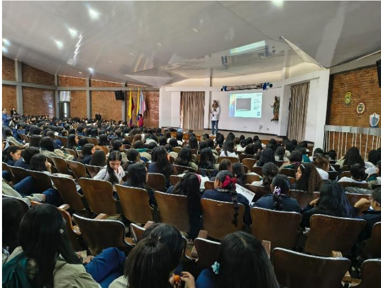
Fotografía de una actividad con adolescentes en un colegio del departamento de Cauca