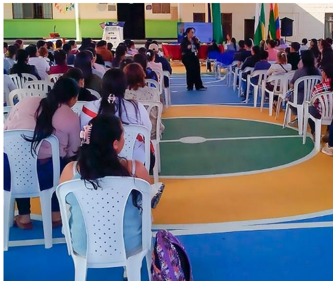
Fotografía de una actividad desarrollada con madres, padres de familia y cuidadores en un colegio del departamento de Santander