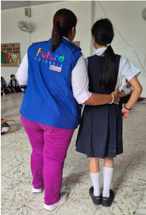
Fotografía de la implementadora del Programa Futuro Colombia, con una estudiante que participó de la actividad realizada en un colegio del departamento de Caquetá