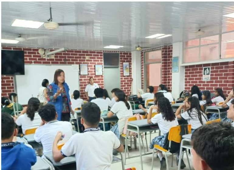
Fotografía de una actividad con adolescentes en un colegio del departamento de Santander