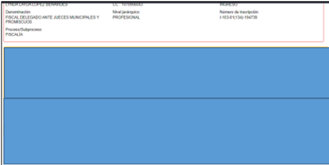
Captura de pantalla tomada de la aplicación SIDCA2

Para el empleo FISCAL DELEGADO ANTE JUECES DEL CIRCUITO, con numero de inscripción I-102-01-(134)-195773, la accionante igualmente fue excluida del proceso de concurso de méritos.